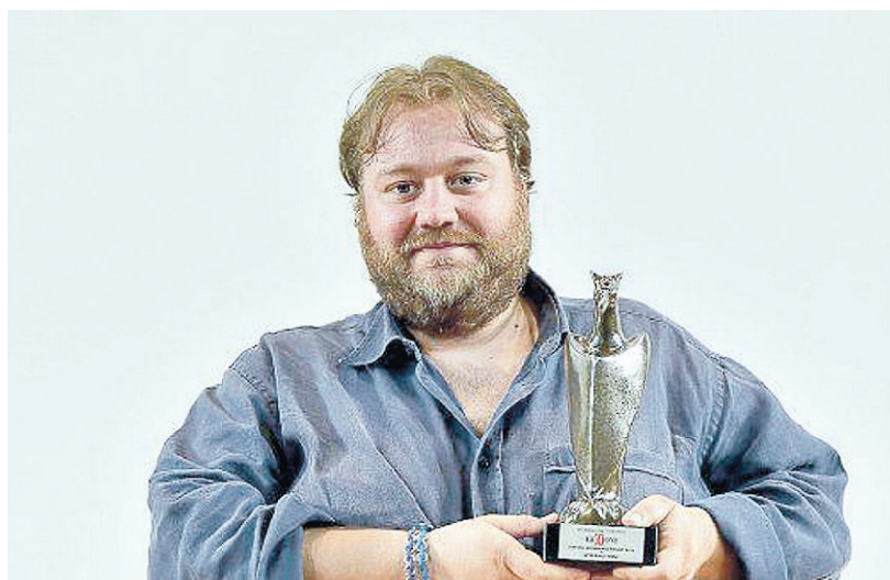
Stefano Fresi, volto noto della fiction, oggi sarà a Tolentino

«La scintilla? Subito. Fui incaricato di scrivere le musiche per uno spettacolo. E in quell'occasione, mi sono innamorato del mondo teatrale. Sono stato letteralmente folgorato, dalle regole, dal rigore, dall'eternità del teatro. Mi piace più