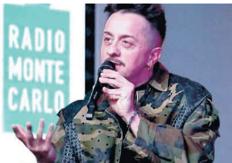
Il musicista, autore e produttore ascolano Dardust, al secolo Dario Faini