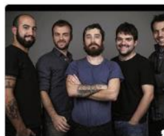
Il Terzo Segreto di Sati...